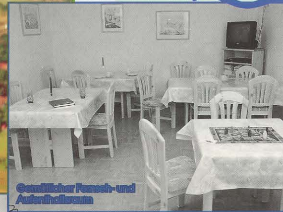
Gemütlicher Fernseh- und Aufenthaltsraum

Das Haus Elwetritsche liegt in ruhiger Lage, mit Blick auf die herrliche Wald- und Felsenlandschaft. 5 Ferienwohnungen für 2 - 5 Personen mit Balkon oder Terrasse.